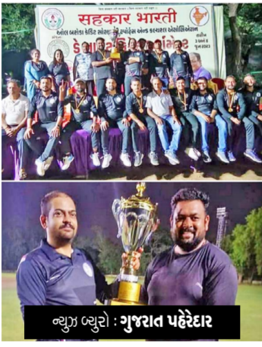
શ્રી છત્રપતિ શિવાજી સહકારી મંડળી ચેમ્પિયન બની હતી.

વડોદરા: સહકારી ક્ષેત્રમાં માત્ર સહકારી કાર્યો જ નહિ પરંતુ પોતાના ક્ષેત્રના કર્મચારીઓ અને સભાસદોને ખેલકૂદમાં આત્મનિર્ભર બનાવવાના ઉદ્દેશથી સહકાર ભારતી ગુજરાત દ્વારા વડોદરા સ્થિત ઓલ વડોદરા કો. કેડેટ સોસાયટી માટેની ક્રિકેટ ટુર્નામેન્ટનું આયોજન કરવામાં આવ્યું હતું જેમાં વડોદરા સ્થિત વિવિધ સોસાયટીઓએ ભાગ લીધો હતો અને દર્શકોને પોતાનામાં રહેલી ખેલકૂદની આવડત દર્શાવી હતી જેમાં ફાઇનલમાં વિજેતા ટીમ તરીકે બરાનપુરા સ્થિત શ્રી છત્રપતિ શિવાજી સહકારી મંડળી ચેમ્પિયન બની હતી.