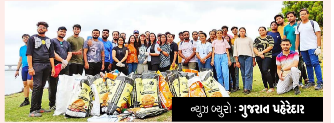
ન્યૂઝ બ્યુરો: ગુજરાત પહેરદાર

ન્યૂઝ બ્યુરો: ગુજરાત પહેરદાર ગુજરાત: રાષ્ટ્રીય સ્વચ્છતા સંઘની ભગિની સંસ્થા "ગંગા સમગ્ર" ના પદાધિકારીઓ દ્વારા તા. પમી જૂન ના રોજ વિશ્વ પર્યાવરણ દિવસ ના અવસરે ગુજરાતના અમદાવાદ, ગાંધીનગર, વડોદરા, સુરત અને તાપી સોનગઢ ખાતે પર્યાવરણ લક્ષી વિવિધ કાર્યક્રમો કરવામાં આવ્યા હતા. જેમાં તાપી અને વિશ્વામિત્રી નદીના કાંઠે મહાભારતી, તેમજ તમામ જગ્યાએ