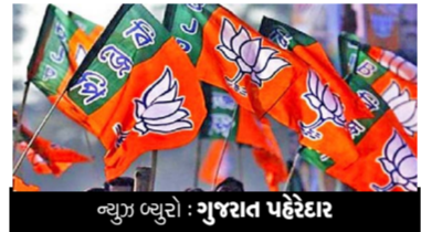
ન્યૂઝ બ્યુરો : ગુજરાત પહેરદાર

ગુજરાતમાં રાજ્યસભાની 3 બેઠકો છે. કોંગ્રેસની કેટલીક બેઠકો પણ આ વખતે ભાજપના ફાળે પૂરતું સંખ્યાબળ ના હોવાના કારણે જશે. ત્યારે ઓગસ્ટ મહિનામાં રાજ્યસભાની ચૂંટણીની અંદર ભાજપ દ્વારા અત્યારના ચહેરાઓ બદલવામાં આવી શકે છે.