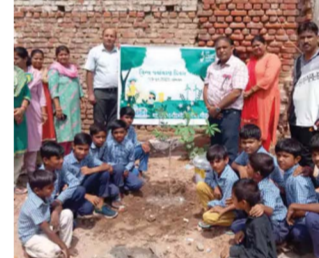
વ્યૂરો વ્યૂરો : ગુજરાત પહેરદાર

પર્યાવરણ દિવસ એટલે વૃક્ષોનું વાવેતર કરવામાં આવે છે. ત્યારે લોક વિજ્ઞાન કેન્દ્ર ગોધરા અને સિવિલ લાયન્સ કન્યાશાળા, દલુની વાડી કુમાર શાળા તેમજ નૂતન ગુજરાતી મિશ્ર શાળાના સંયુક્ત ઉપક્રમે આજરોજ વૃક્ષારોપણનો કાર્યક્રમ દલુની વાડી કેમ્પસમાં રાખી વિશ્વ પર્યાવરણ દિવસની ઉજવણી કરવામાં આવી હતી. જેમાં ત્રણેય શાળાઓના આચાર્ય, શિક્ષકો, વિદ્યાર્થીઓ ઉપસ્થિત રહ્યા હતા