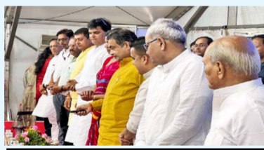
ન્યૂઝ બ્યુરો : ગુજરાત પહેરદાર

માળખાકીય સુવિધાઓનું નિર્માણ રાજ્ય અને દેશના સામાજિક અને આર્થિક વિકાસમાં વધારો કરે છે. નેશનલ હાઈવે 48 ના અમદાવાદ-વડોદરા સેકશનની દુમાડ ચોકડી પાસે સુધારણાની કામગીરી કરવામાં આવી છે. 27.01 કરોડના ખર્ચે લગભગ 3 કિલોમીટર લંબાઈના આ પ્રોજેક્ટનું આજે ઉદ્ઘાટન કરાયું છે. જેમાં નવા સર્વિસ રોડ, વાહનોના અંડરપાસ અને આરસીસી કેશ બેરિયર બનાવ્યા છે, જેનાથી ટ્રાફિક જામની સમસ્યા દૂર થશે અને મુસાફરી વધુ સુરક્ષિત બનશે. રાષ્ટ્રને સમર્પિત કરવામાં આવનાર રૂ. 17 કરોડના ખર્ચના બીજા પ્રોજેક્ટની લંબાઈ લગભગ 1 કિમી છે. આ પ્રોજેક્ટમાં વડોદરાના નેશનલ હાઈવે 48 દેના જંકશન પાસે અંડરપાસ અને સર્વિસ રોડ બનાવવામાં આવ્યો છે. આ પ્રોજેક્ટ હેઠળ સૌર ઉર્જાથી ચાલતી સ્ટ્રીટ લાઈટનો પ્રથમવાર નેશનલ હાઈવે 48 પર ઉપયોગ કરવામાં આવ્યો છે.