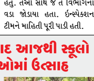
વ્યૂરો વ્યૂરો : ગુજરાત પહેરદાર

2024-025ના નવા શૈક્ષણિક સત્રનો આજથી પ્રારંભ થયો છે. સવારની સ્કૂલોમાં અભ્યાસ કરવા માટે આવેલા વિદ્યાર્થીઓથી સ્કૂલોનું કેમ્પસ પ્લે સેન્ટરના ભુલકાંઓ અને વિદ્યાર્થીઓના કિલકારીથી ગુંજ ઉઠ્યા હતા. નવા શૈક્ષણિક સત્રની શરૂઆત સાથે વિદ્યાર્થીઓ અને વાલીઓમાં અનેરો ઉત્સાહ જોવા મળ્યો હતો. ખાસ કરીને પાસ થઈને ઉપરના વર્ગમાં ગયેલા વિદ્યાર્થીઓમાં સ્કૂલે જવાની ભારે ઉત્સુકતા જોવા મળી હતી. શૈક્ષણિક સત્રના સૌથી લાંબા