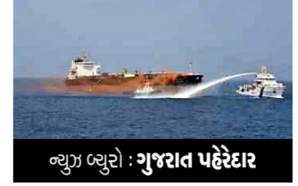
ન્યૂઝ બ્યુરો: ગુજરાત પહેરદાર

દરિયાઈ વિસ્તારની સુરક્ષાની સાથે સાથે ભારતીય કોસ્ટગાર્ડ દરિયાઈ પ્રદૂષણ નિયંત્રણ માટે પર્યાવરણ મિત્ર બનીને કાર્યરત રહે છે. મેક ઈન ઈન્ડિયા દ્વારા તૈયાર કરવામાં આવેલ "સમુદ્ર પાવક" નામનું જહાજ દરિયાઈ પ્રદૂષણ નિયંત્રણ માટે ખૂબ જ મહત્વનું અને આધુનિક સુવિધા અને સાધનોથી સજ્જ જહાજ છે.