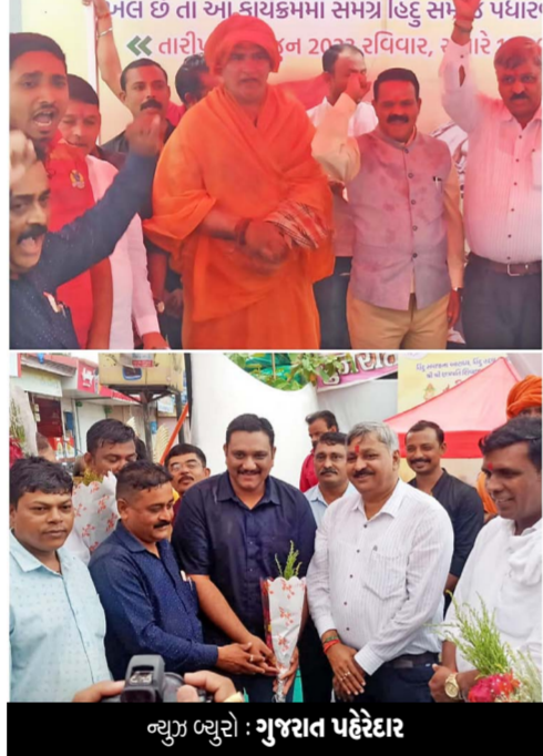
મહારાજ સ્મારક સમિતિ, વ્યારાના સૌ હોદ્દાદારો અને મોટી સંખ્યામાં શિવપ્રેમીઓ ઉપસ્થિત રહ્યા હતા.