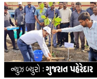
વ્યૂરો વ્યૂરો : ગુજરાત પહેરદાર

પશ્ચિમ રેલવે રાજકોટ દ્વારા પરિવારણ દિવસ અંતર્ગત વૃક્ષો વાવ્યા: અધિકારીઓએ બાલાસોર દુર્ઘટનાનાં મૃતકો પાછળ મૌન પાડ્યું આજે પ મી જૂન વિશ્વ પર્યાવરણ દિવસ ઠેર ઠેર વિશ્વ પર્યાવરણ દિવસની ઉજવણી થશે. વૃક્ષો વાવવાની વાત થશે ત્યારે આપણા રાજકોટ પશ્ચિમ રેલવે પણ વૃક્ષો વાવી જતાં કરવા બધા અધિકારીઓ ભેગા થયા હતા અને "બીટ પ્લાસ્ટિક પોલ્યુશન"