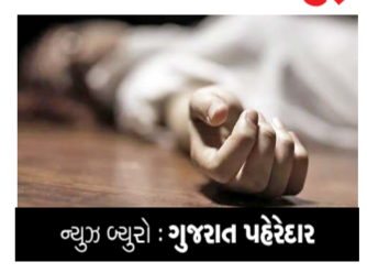
ન્યૂઝ બ્યુરો: ગુજરાત પહેરદાર

રાજકોટમાં વધ્યા આપઘાતના બનાવ: માતાએ પોતાના બે બાળકોને મોતને ઘાટ ઉતારી પોતે પણ ગળે ટૂંપો દઈ દીધો રાજકોટમાં દિવસેને દિવસે આત્મહત્યાના બનાવ વધતા જઈ રહ્યા છે. લોકોમાં સહન શક્તિ પૂરી થઈ ગઈ હોય તેમ લોકો નાની નાની વાતે અમૂલ્ય જીવનનો અંત કરી નાખે છે. લોકો આત્મહત્યાની જાણે છેલ્લું પગલું વિચારી પોતાના જીવનનો અંત કરી બેસે છે જે તદન