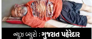
વ્યૂરો વ્યૂરો : ગુજરાત પહેરદાર