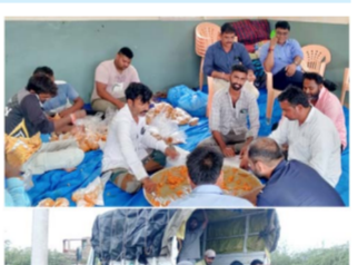
હતું. જે સેવા કાર્ય તારીખ ૧૧મી જૂન થી લઈને હાલ સુધી ચાલી રહ્યું છે.