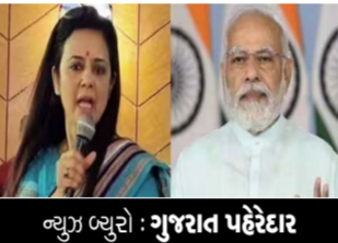
ન્યુઝ બ્યુરો : ગુજરાત પહેરેદાર

કહ્યું કે, પીએમએ પણ તેમના રાજધર્મનું યોગ્ય રીતે પાલન કરવું જોઈએ. જયરામ રમેશનો હુમલો મન કી બાત પર કોંગ્રેસના નેતા જયરામ રમેશે કહ્યું કે, વડાપ્રધાને 'આપતિ વ્યવસ્થાપનમાં ભારતની મહાન ક્ષમતાઓ' માટે પોતાની પીઠ થપથપાવી હતી, પરંતુ મહિાપુરનો સામનો કરી રહેલી જયરામ રમેશે કહ્યું કે, વડાપ્રધાને 'આપતિ વ્યવસ્થાપનમાં ભારતની મહાન ક્ષમતાઓ' માટે પોતાની પીઠ થપથપાવી હતી, પરંતુ મહિાપુરનો સામનો કરી રહેલી મોન રહ્યા હતા. જયરામે કહ્યું - 'અન્ય એક મન કી વાત પરંતુ મહિાપુર પર મોન. પીએમ આપતિ વ્યવસ્થાપનમાં ભારતની મહાન ક્ષમતાઓ માટે પીઠ થપથપાવે છે, પરંતુ શું તેઓ મહિાપુર પર બોલશે. મહિાપુર સળગી રહ્યું છે, પરંતુ પીએમ દ્વારા શાંતિની કોઈ અપીલ કરવામાં આવી નથી.'