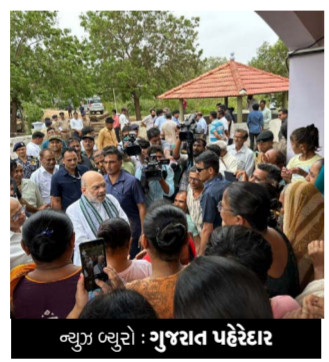
ન્યૂઝ બ્યુરો : ગુજરાત પહેરદાર

કેન્દ્રિય ગૃહમંત્રી અમિત ભાઈ શાહ બિપરજોય વાવાઝોડા બાદ કચ્છમાં ઊભી થયેલી સમીક્ષા માટે કચ્છ પહોંચ્યા હતા. મુખ્યમંત્રી ભુપેન્દ્ર પટેલે પણ કેન્દ્રિય ગૃહમંત્રી સાથે ઉપસ્થિત રહીને વર્તમાન સ્થિતિનો ખ્યાલ મેળવ્યો હતો. કેન્દ્રિય ગૃહમંત્રીએ કાઠડાના આર્ય ફાર્મની મુલાકાત લઈને ખેતૂતો પાસેથી પાક નુકસાન વિશે વિગતવાર જાણકારી મેળવી હતી.