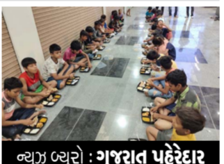
મોટી સંખ્યામાં ગરીબ બાળકોએ ભોજનનો સ્વાદ માણ્યો હતો.