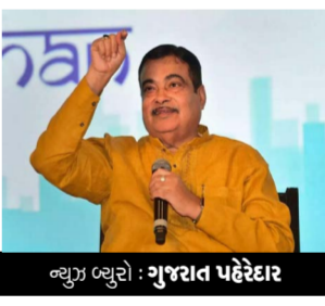
ન્યૂઝ બ્યુરો : ગુજરાત પહેરદાર

નાગપુરમાં ભારતીય જનતા પાર્ટીના સ્નેહ સંમેલનમાં કેન્દ્રીય મંત્રી નિતિન ગડકરીએ વિચિત્ર નિવેદન આપ્યું છે. ગડકરીએ કહ્યું કે ભારતીય જનતા પાર્ટી કાર્યકરોની પાર્ટી છે, પિતા-પુત્રની પાર્ટી નથી. આ સાથે જ વિપક્ષને ટોણો મારતા તેમણે ઉપદેશક સ્વરમાં કહ્યું કે, પતિએ પત્નીની ટિકિટ ન માંગવી જોઈએ. ભારતીય જનતા પાર્ટીમાં પીએમના પેટથી પીએમ, સીએમના પેટથી સીએમ કે મંત્રીના પેટથી મંત્રી પેદા નથી થતા.