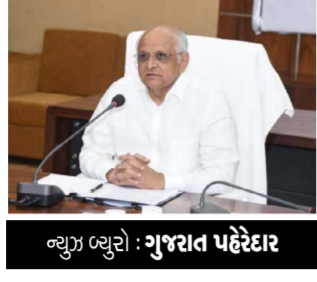
ન્યુઝ બ્યુરો : ગુજરાત પહેરેદાર

ગાંધીનગર: મુખ્યમંત્રી ભૂપેન્દ્ર પટેલે રાજ્યના પાટનગર ગાંધીનગર મહાનગરના ડ્રેનેજ નેટવર્કના સુવ્યવસ્થિત વ્યવસ્થાપનની જરૂરિયાત ધ્યાને લઈ એક મહત્વપૂર્ણ નિર્ણય કર્યો છે. આ નિર્ણય અનુસાર, ગાંધીનગર શહેરની ડ્રેનેજલાઈન નેટવર્કના સંચાલન, મરામત અને નિભાવણીની કામગીરી માર્ગ-મકાન વિભાગને બદલે હવે ગાંધીનગર મહાનગરપાલિકાને