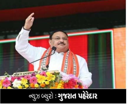
ન્યુઝ બ્યુરો : ગુજરાત પહેરેદાર

ભાજપ અધ્યક્ષ જેપી નહાએ કેન્દ્રમાં કાર્યકાળના 9 વર્ષ પૂર્ણ કરવા પર વડાપ્રધાન નરેન્દ્ર મોદી સરકારના વખાણ કર્યા છે. તેમણે કહ્યું કે, વડાપ્રધાન નરેન્દ્ર મોદીના નેતૃત્વમાં દેશને અભૂતપૂર્વ વિકાસ જોવો છે. પીએમ મોદીએ છેલ્લા નવ વર્ષમાં 'ભારતનું નસીબ બદલી નાખ્યું છે'. મોદી સરકારને 9 વર્ષ પૂરા ભાજપ પ્રમુખે ઈન્ફ્રાસ્ટ્રક્ચર નિર્માણ, સુશાસન અને સર્વાંગી વિકાસને મોદી સરકારના માપદંડો ગણાવ્યા. તમને જણાવી દઈએ કે, ત્રિપુરા સંતીરબજાર શાળા મેદાનમાં મોદી સરકારના નવ વર્ષ પૂર્ણ થવાના અવસર પર એક રેલીને સંબોધિત કરી રહ્યા હતા. અહીં તેમણે છેલ્લા નવ વર્ષમાં કરેલા કાર્યો પર પ્રકાશ નાખ્યો હતો. 13,125 કિમી સરહદી રસ્તાઓ બનાવવામાં